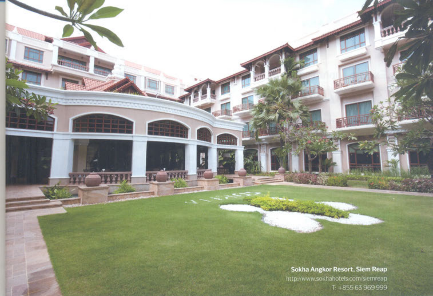
Sokha Angkor Resort, Siem Reap